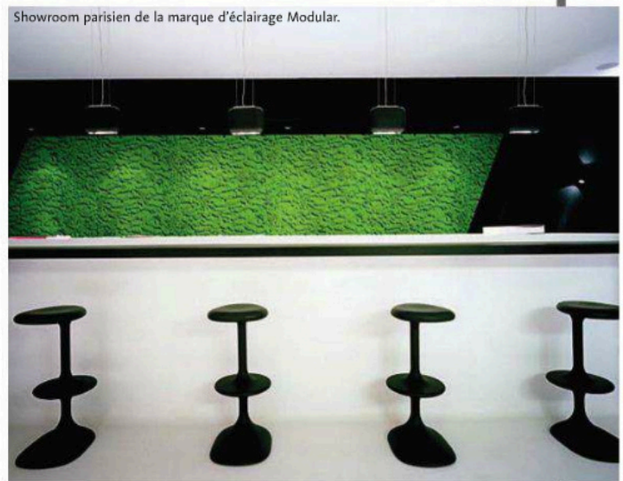
Showroom parisien de la marque d'éclairage Modular.