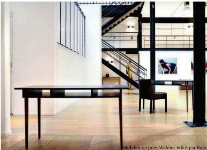
Mobilier de Jules Wabbes édité par Bulo.

DOSSIER RÉALISÉ PAR GUY-CLAUDE AGBOTON, MARIE GODFRAIN, THÉRÈSE ROCHER, CLÉMENT SAUVOY ET OLIVIER WACHÉ