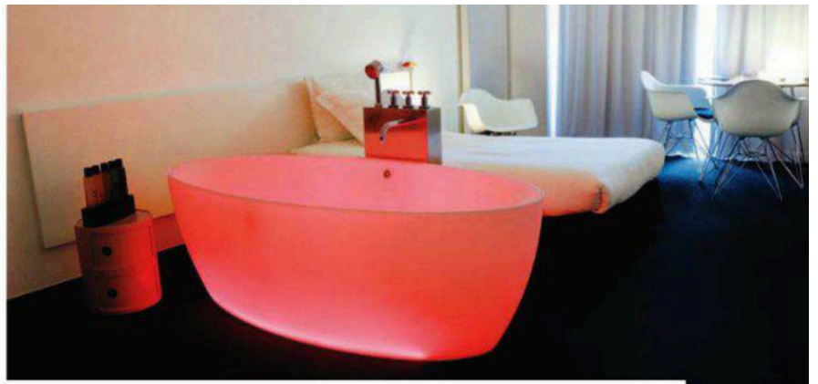
Baignoire Dip au White Hotel de Bruxelles.