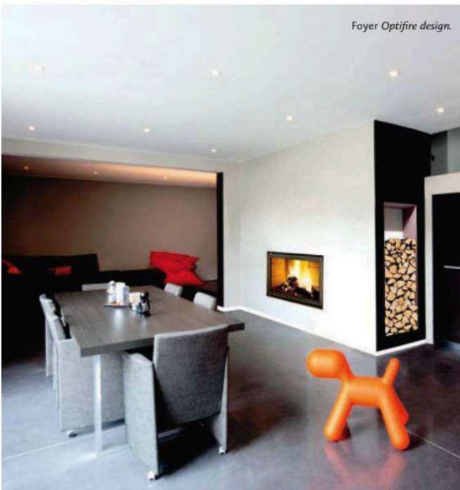
Foyer Optifire design .