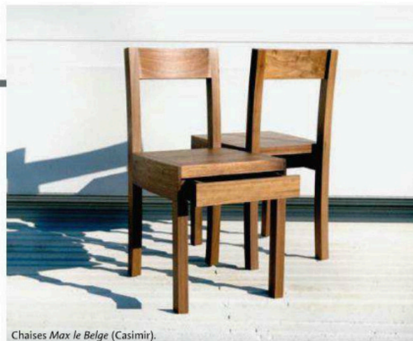
Chaises Max le Belge (Casimir).