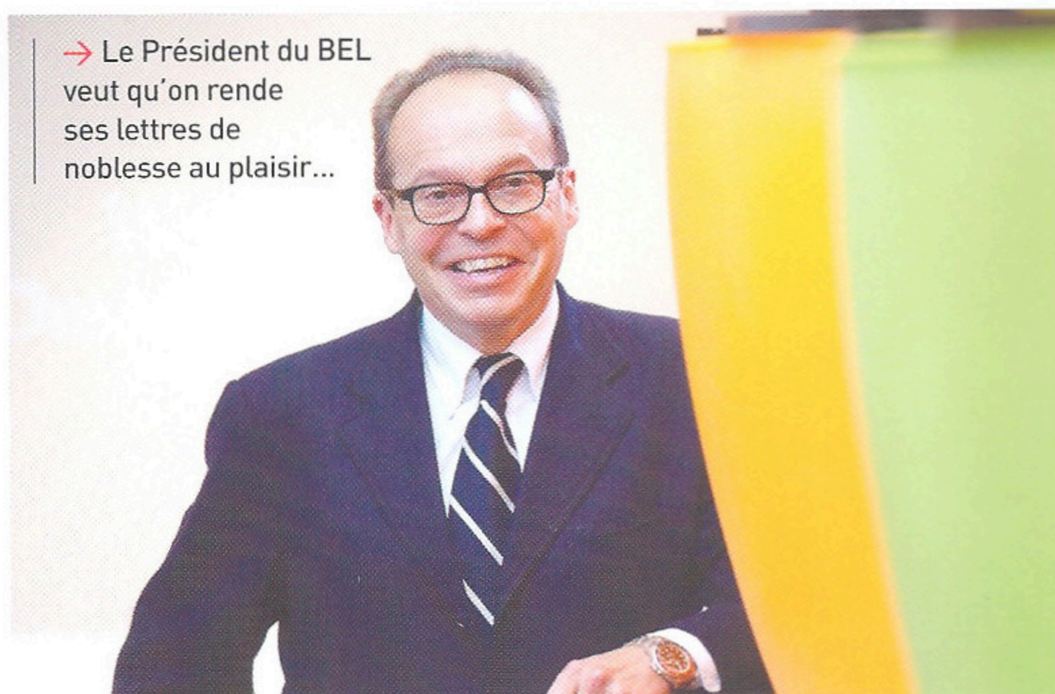
→ Le Président du BEL veut qu'on rende ses lettres de noblesse au plaisir...

Ce qui me frappe, c'est qu'en 2009, l'épargne belge ne s'est jamais aussi bien portée : il y a aujourd'hui un matelas de 200 milliards d'euros d'épargne qu'on laisse dormir sur des comptes qui ne rapportent presque rien ! Il est temps que nous revalorisons le plaisir, celui que l'on fait et celui que l'on se fait... Le plaisir est un incroyable moteur pour nous qui le matérialisons chaque jour et pour nos clients qui nous font confiance. Rendons au plaisir ses lettres de noblesse, et l'avenir nous appartiendra ! ○